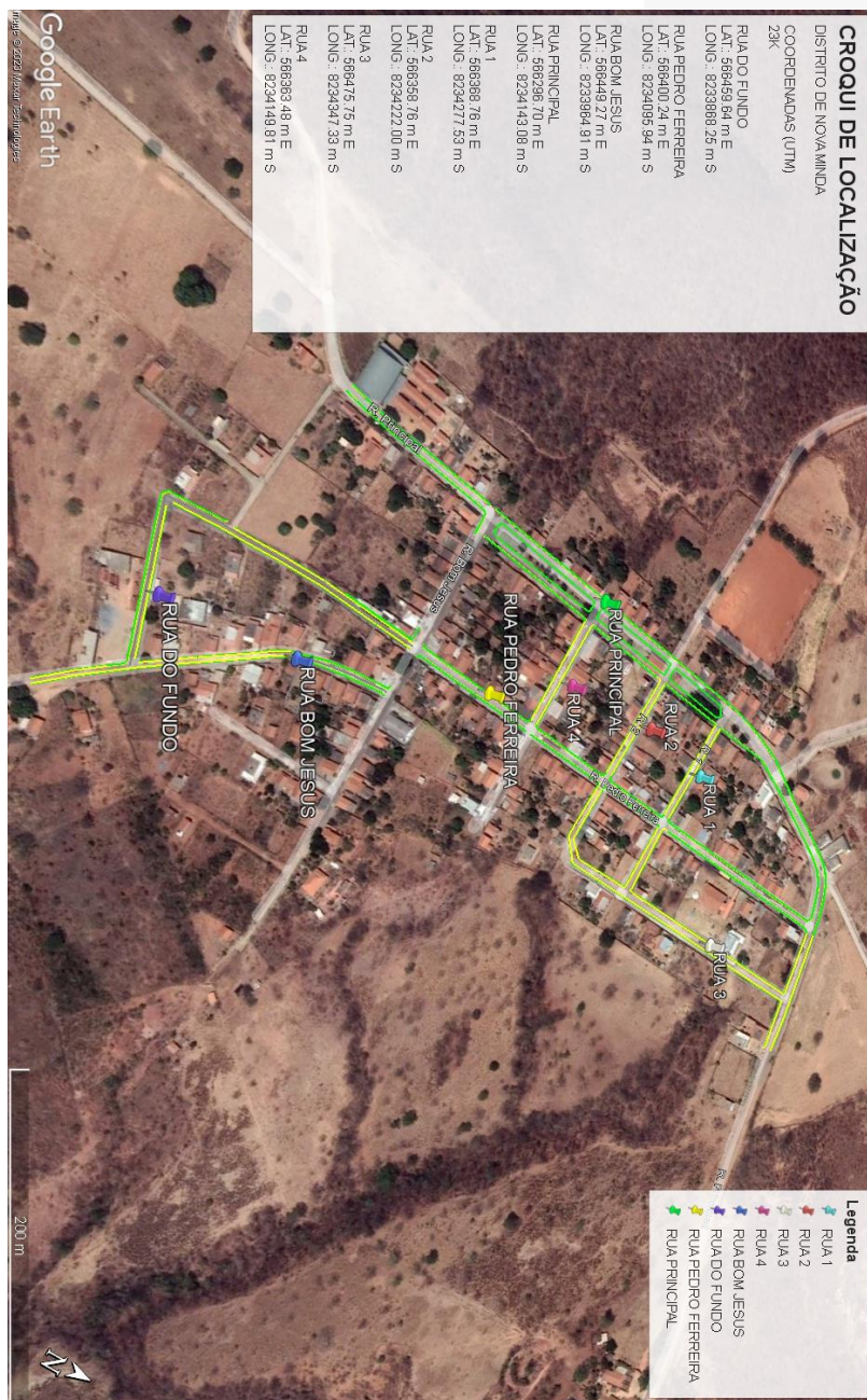
IMAGEM REFERENTE A LOCALIZAÇÃO DAS VIAS ABRANGIDAS PELO PROJETO, NO DISTRITO DE NOVA MINDA.