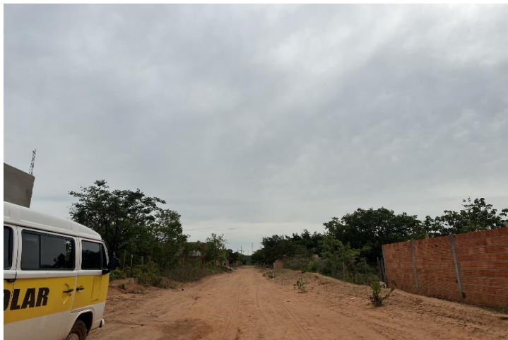
Descrição: Rua Montalvânia