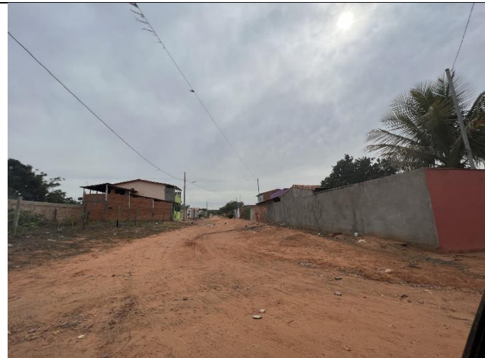
Descrição: Rua Montalvânia